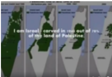
Documentary explaining Palestine's Occupation

Χιλιάδες Παλαιστίνιοι εκτοπίστηκαν από τα σπίτια τους, αλλά παρέμειναν εντός της ελεγχόμενης από το Ισραήλ επικράτειας του 1948. Σύμφωνα με στοιχεία ντοκουμέντα , οι σιωνιστικές δυνάμεις έλεγχαν 774 πόλεις και χωριά και κατέστρεψαν 531 Παλαιστινιακές πόλεις και χωριά κατά τη διάρκεια της Νάκμπα . Στις θηριωδίες των σιωνιστικών δυνάμεων περιλαμβάνονται επίσης περισσότερες από 70 σφαγές όπου περισσότεροι από 15 χιλιάδες Παλαιστίνιοι σκοτώθηκαν.